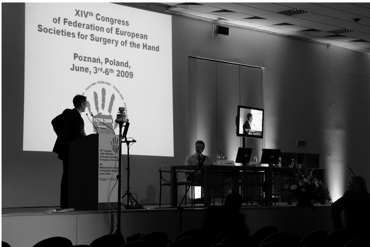
Ryc. 4. Prezentacje naukowe podczas sesji