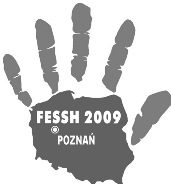
Ryc. 2. Logo FESSH 2009 Poznań